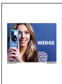
Exemple de configuration