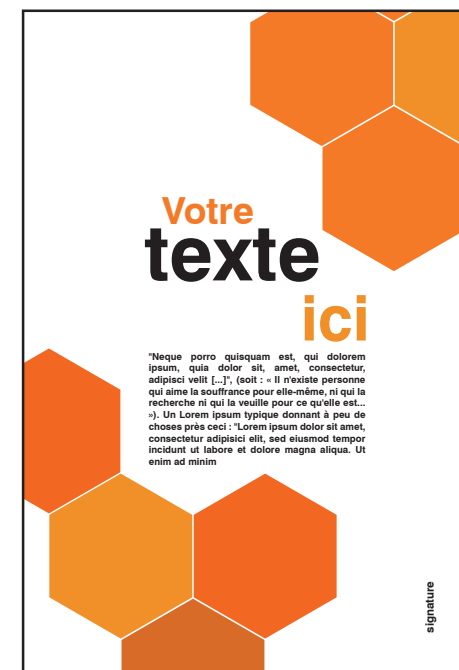
Format fini du fichier : 297x420 mm